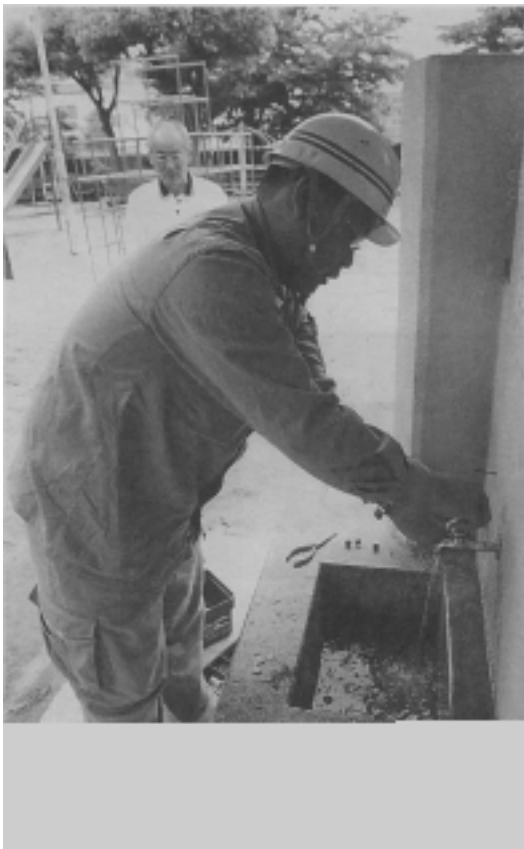
給水装置点検（日分公園） よ～しOK！！