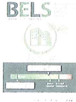
〔図1〕 ガイドラインに基づく第三者認証の例

また、ダイヤモンドリスponsに対応した時間帯別・季節別の電気料金メニューが選択できる場合はその活用に努めるとともに、エネルギー管理システム（BEMS・HEMS等）の導入により、ビルの運用方法、住宅の住まい方の改善によるピーク対策及び省エネルギーに努めること。