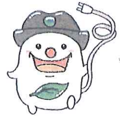
環境キャラクター 「エコくん」

6月から9月までの期間はエネルギー消費が増加する季節です。 無理のない範囲で省エネに取り組みましょう。