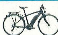
CORRATEC E-POWER SHAPE